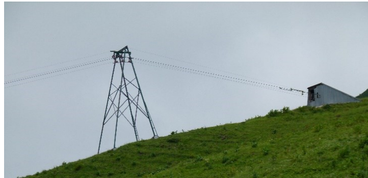
Nouvelle gare d'arrivée