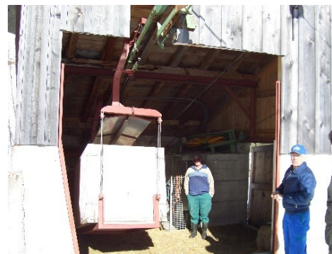
Nouvelle station de départ