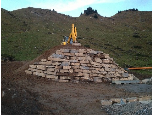
Ancienne gare d'arrivée